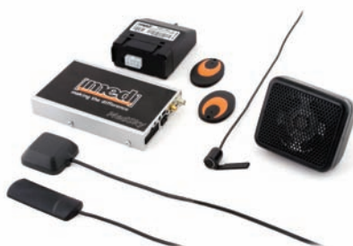
MS3 V TX

DISPONIBLE AUSSI DANS LES VERSIONS SUIVANTES: MS3CAN, MS3TX, MS3V, MS3VCAN, MS3VTX, MS3.1 CAN, MS3.1TX